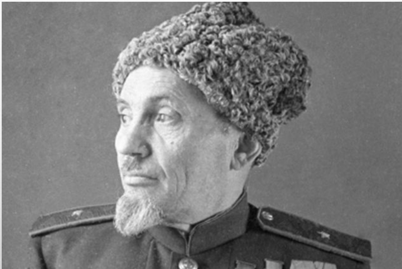
Сидор Артемьевич Ковпак