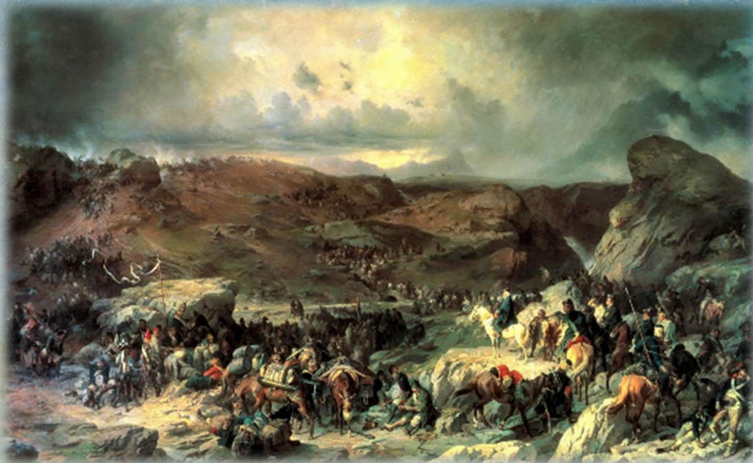
«Переход войск Суворова через Сен-Готард 13 сентября 1799 года» Худ. А.Коцеба