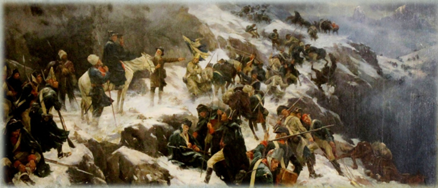
«Переход Суворова через Альпы» Худ. А. Попов.