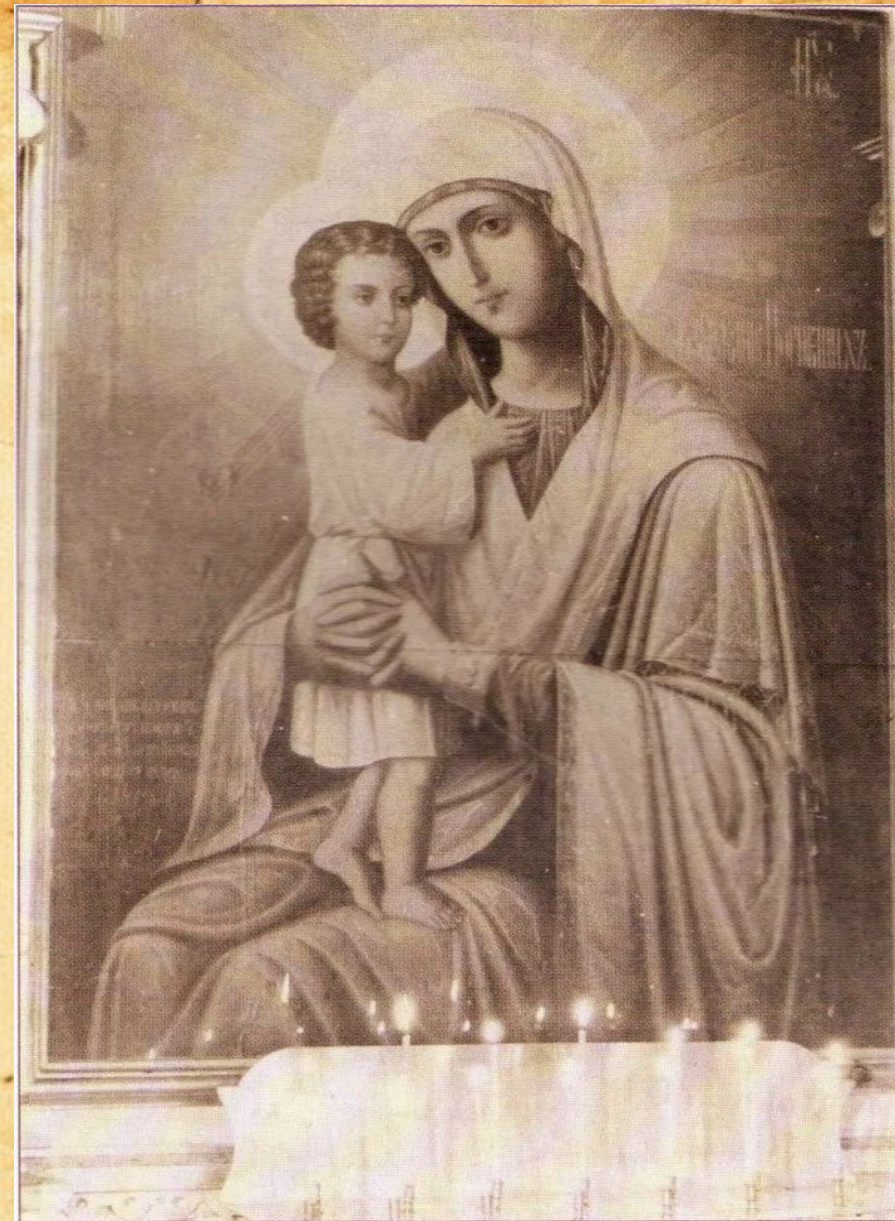
Икона Божией Матери «Взыскание погибших» из Сталинграда. Холст, масло.